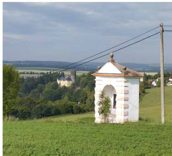
Obrázek 7 – Maria Loreto – jedna z kaplí pašijové cesty

V barokním období se běžně posvátnost věhlasných poutních míst šířila dokonalými či rustikálními kopiemi milostných obrazů, soch a celých staveb, pro které dokonce bývala vybírána krajina s podobnou konfigurací terénu, v níž „originál“ stál. To mělo akcentovat jejich autenticitu, kterou často dosvědčovala i legenda o cestě zakladatele nebo jím pověřené osoby do svatých míst ke zjištění správných rozměrů [38, s. 112].