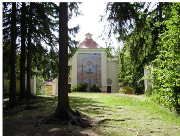
Obrázek 1 – Čestická Kalvárie. Řada poutních míst představuje unikátní spojení architektury a působivého krajinného rámce. Taková místa nikdy nejsou místa, která si člověk vybírá, jen je odhaluje [28]

Cílem příspěvku je v první řadě na základě literatury a dokumentů představit fenomén putování jakožto všeobecně lidskou potřebu a výmluvný symbol promlouvající i do současnosti. V druhé řadě pak, vycházející z výsledků analýz prováděných v rámci projektu NAKI II a v rámci krajinářského workshopu Katedry urbanismu a územního plánování FSV ČVUT, poukázat na méně známé poutní místo Starý Hrožňatov, jehož osud ve 20. století odráží osudy našeho pohraničí a jehož téměř „záračné“ znovuzrození je symbolem naděje do budoucnosti. Text navazuje na autorovu rigorózní práci obhájenou na KTF UK v roce 2010 a na další publikované práce.