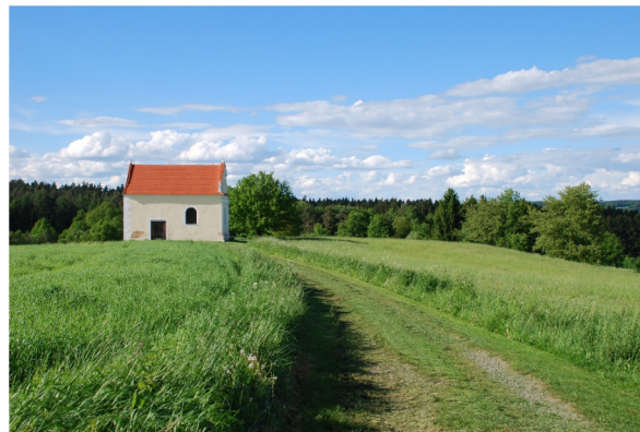
Obrázek 3 – Římov. Kalvárie typu „mapa“ představuje topografickou kopii Jeruzaléma

a s vlajícími prapory za obzor svého bydliště, zapomněl na své starosti a duševně pookřál. Venkovský člověk připoutaný k půdě měl tak jedinečnou možnost poznat jiné kraje, jiné lidi. Poutě na posvátná místa se konaly jako poutě prosebné i jako poutě kající, neboť obtíže na takové cestě spojené s mnoha oběťmi a sebezapíráním byly zároveň skutkem kajícím a pokáním [19, s. 9] [8, s. 56nn]. Program poutě tvořila řada ceremonií, pobožností a písní určených pro různé příležitosti při cestě i na poutním místě samém. V průvodu byly nošeny sochy, kříže a korouhve. Někdy se šlo i několik dnů pěšky a lidé přinášeli značné osobní oběti, například i tím, že v období nutných zemědělských prací, na nichž mnohdy záležela jejich existence, opouštěli na několik dnů své domovy.