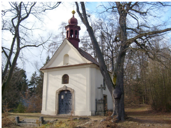
Obrázek 4 – Malá Svatá Hora. Zastávka poutníků na poutní cestě z Prahy na Svatou Horu

nepřízní počasí. Barokní poutě se tedy nevepsaly do české krajiny jen vlastním poutním místem, ale řadou dalších doprovodných objektů a poutních cest, které křížovaly krajinu. Patří ke kulturnímu dědictví, k naší národní identitě a k významným hodnotám kulturní a historické charakteristiky krajiny. Poutní místo náleží k nejtypičtějším projevům úkazu, kterému se tradičně říká genius loci , zvláštní kouzlo a osobitost místa [17, s. 5].