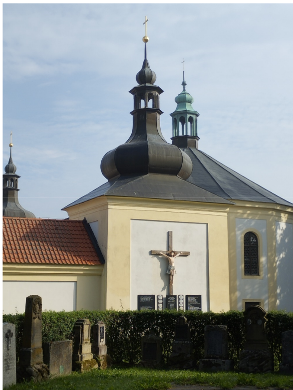
Obrázek 6 – Maria Loreto – obnovený kostel

zhmotněný v zastaveních pašijové cesty nacházejících se ve volné krajině – ve vsi, v polích, v lese i v údolí – přenášejících sem ze Svaté země mystérium utrpení Ježíše Krista [34, s. 290]. Mezi pašijovými cestami v Čechách jde spolu s jihočeským Římovem o naprosté unikáty: topografické „kopie“ jeruzalémského originálu, kde na jedné straně je Olivetská (též Olivová) hora, potok Cedron a na druhé Kalvárie (Golgota) s Božím hrobem [35]. Poutník rozjímá nad odčiněním lidských hříchů, které Kristus svým utrpením podstoupil a tím dal člověku naději na spásu, která se uskutečňuje v církvi vytvořené sesláním Ducha svatého, což je třetí moment, akcentovaný kostelem sv. Ducha [34, s. 290][36, s. 3][37, s. 95].