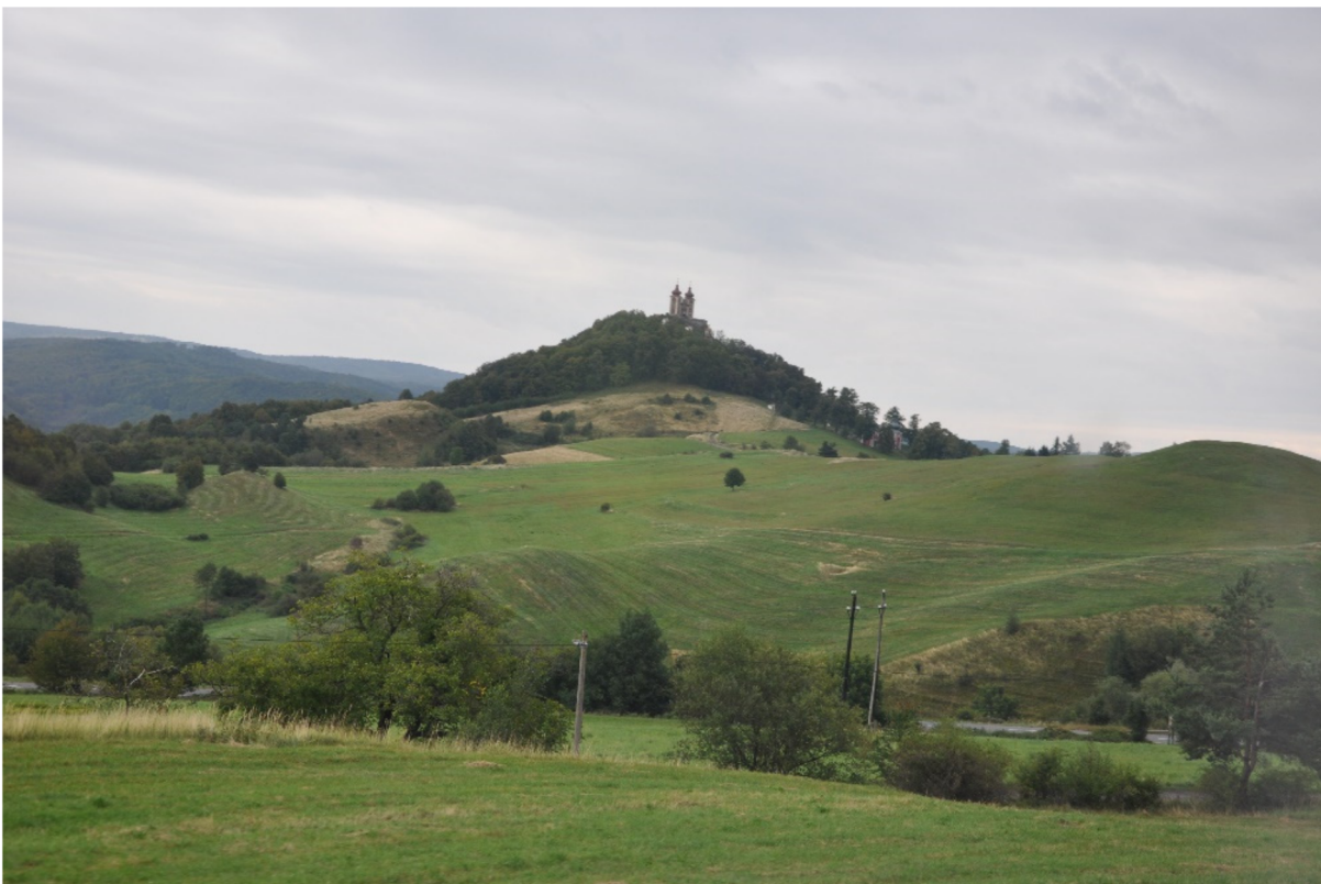
Obrázek 5 – Banskštiavnická Kalvárie

V tradičních společenstvích jsou kosmické úrovně – podsvětí, země a nebe – propojeny. Spojení je vyjadřováno obrazem axis mundi , která spojuje a zároveň podpírá nebe i zemi. Okolo této osy se rozkládá svět, osa se nachází „uprostřed“, na „pupku země“, je středem světa. Posvátné místo tvoří zlom v homogenním prostoru, tento zlom je symbolizován otvorem, kterým lze přecházet z jedné oblasti do druhé. Jedním z četných obrazů je kosmická hora, která vyjadřuje spojení mezi nebem a zemí. Hora náleží „zemi“, ale zvedá se k nebi. Je „vysoká“, blízka nebi, je místem setkání obou elementů. Proto byly hory považovány za „centra“ jimiž prochází axis mundi