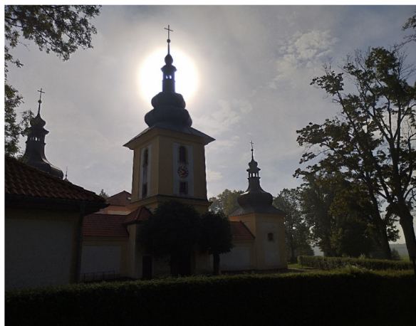
Obrázek 8 – Maria Loreto

Areál Maria Loreto, nacházející se v blízkosti státních hranic, značně utrpěl v průběhu minulého století. Již při náletu na Cheb v roce 1944 byla silně poškozena kaple III–IV. Po odsunu německého obyvatelstva v letech 1945–1946 zcela skončil život poutního místa v roce 1951, kdy se zde sloužila poslední mše svatá. Pak bylo celé území uzavřeno jako součást hraničního pásma. V roce 1952 vyhořela zvonice loretu a byla zbořena vedle stojící budova školy (postavená v roce 1668, v roce 1833 nahrazená větší). Následovala dlouhodobá devastace spojená s rozkradením mobiliáře. Z loretu se stala zřícenina, mnoho kaplí pašijové cesty bylo zbořeno, ostatní ponechány svému osudu. Z 23 kaplí jich 12 zaniklo. V roce 1985 se dokonce začalo jednat o upuštění od památkové ochrany loretu, k čemuž nakonec naštěstí nedošlo [42, s. 109]. Prostor prvního zastavení u zaniklého Podhradu byl navíc zaplaven Jesenickou přehradou.