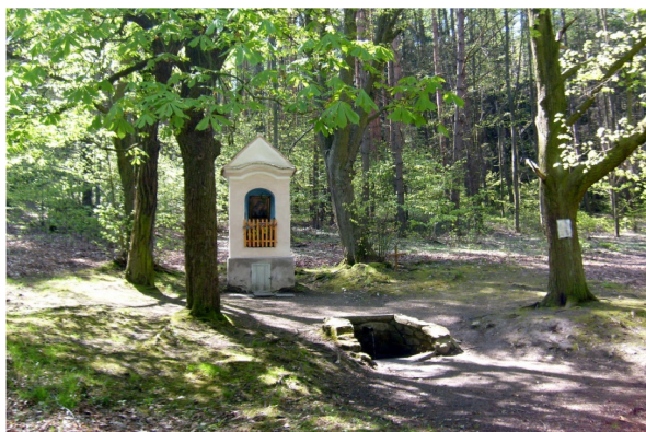
Obrázek 2 – Podsrp u Strakoníc. Architektonicky upravený pramen či studánka patří k tradičním součástem poutních míst

pouť do města, kde se uchovávala archa úmluvy, nebo že navštívili svatyni v Betelu či svatyni v Šílu, jež byla svědkem vyslyšení modlitby Anny, Samuelovy matky. Také Ježíš putoval s Marií a Josefem do svatého města Jeruzaléma. Náboženské poutě jsou charakteristickým fenoménem i křesťanské zbožnosti již od nejstarších dob. Zvláštní místo v historii zaujímají tzv. husitské poutě na hory, které byly inspirovány eschatologickými předpověďmi [5, s. 122]. Člověk putující světem, mířící do nebeského Jeruzaléma, patří k tradičním obrazům křesťana. Pouť odpovídá situaci člověka, který rád popisuje svůj život jako cestu. Od narození až po smrt prožívá každý vlastní situaci putujícího člověka ( homo viator ). Již samo „vystupování“ do svatyně naplňuje nepopíratelná spiritualita, jistá askeze, předobraz „ vystupování do nebeského Jeruzaléma “, útěk ze světa ( fuga mundi ), stesk po nebi spojený se steskem po „jiném“ lidském soužití [6, s. 1171].